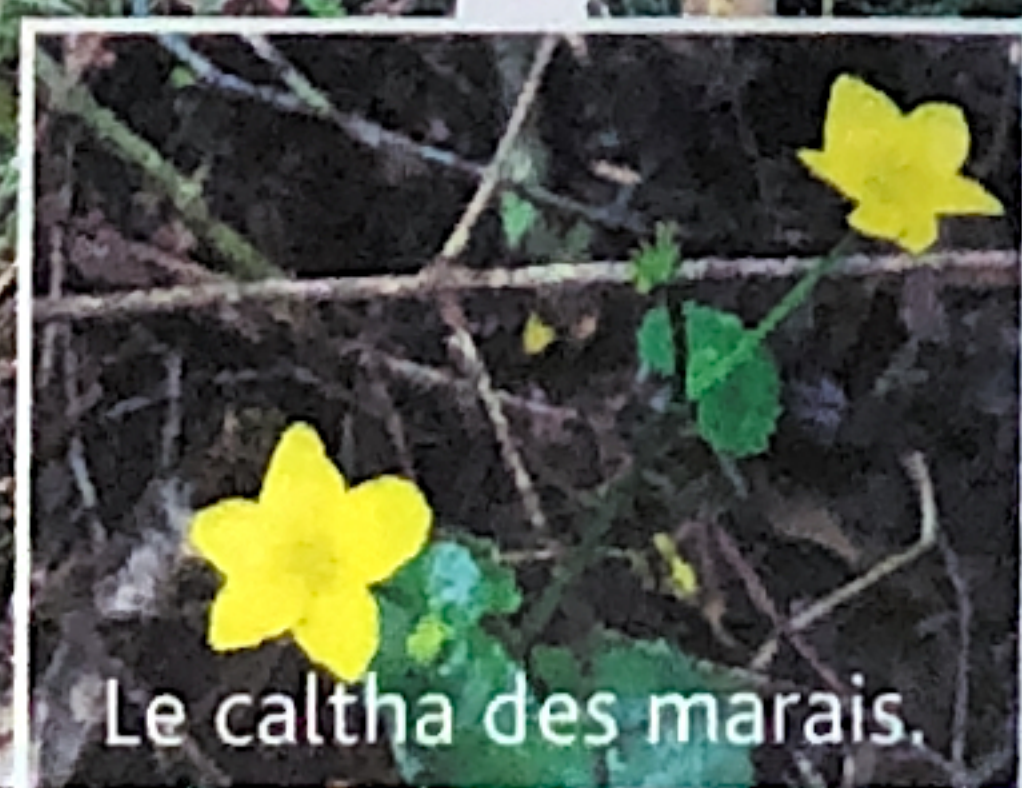
Le caltha des marais.