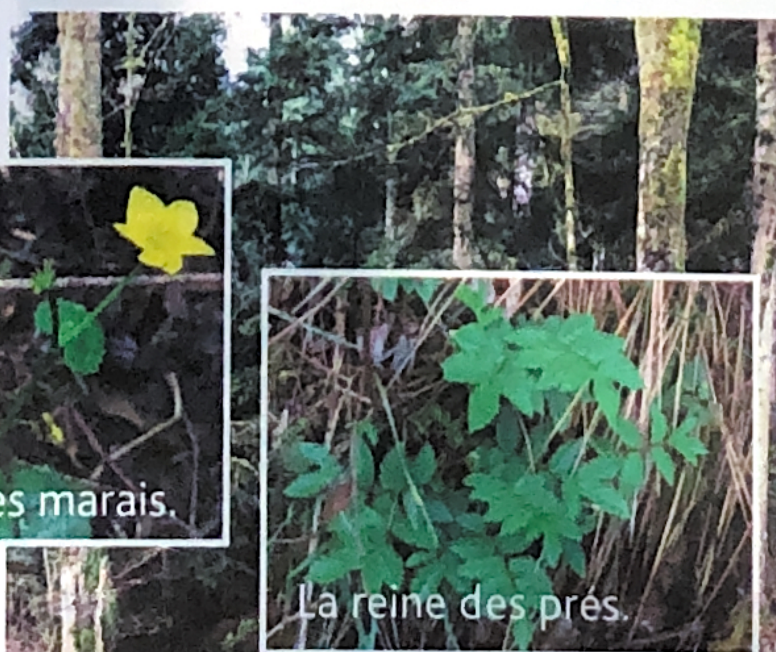
La reine des prés.