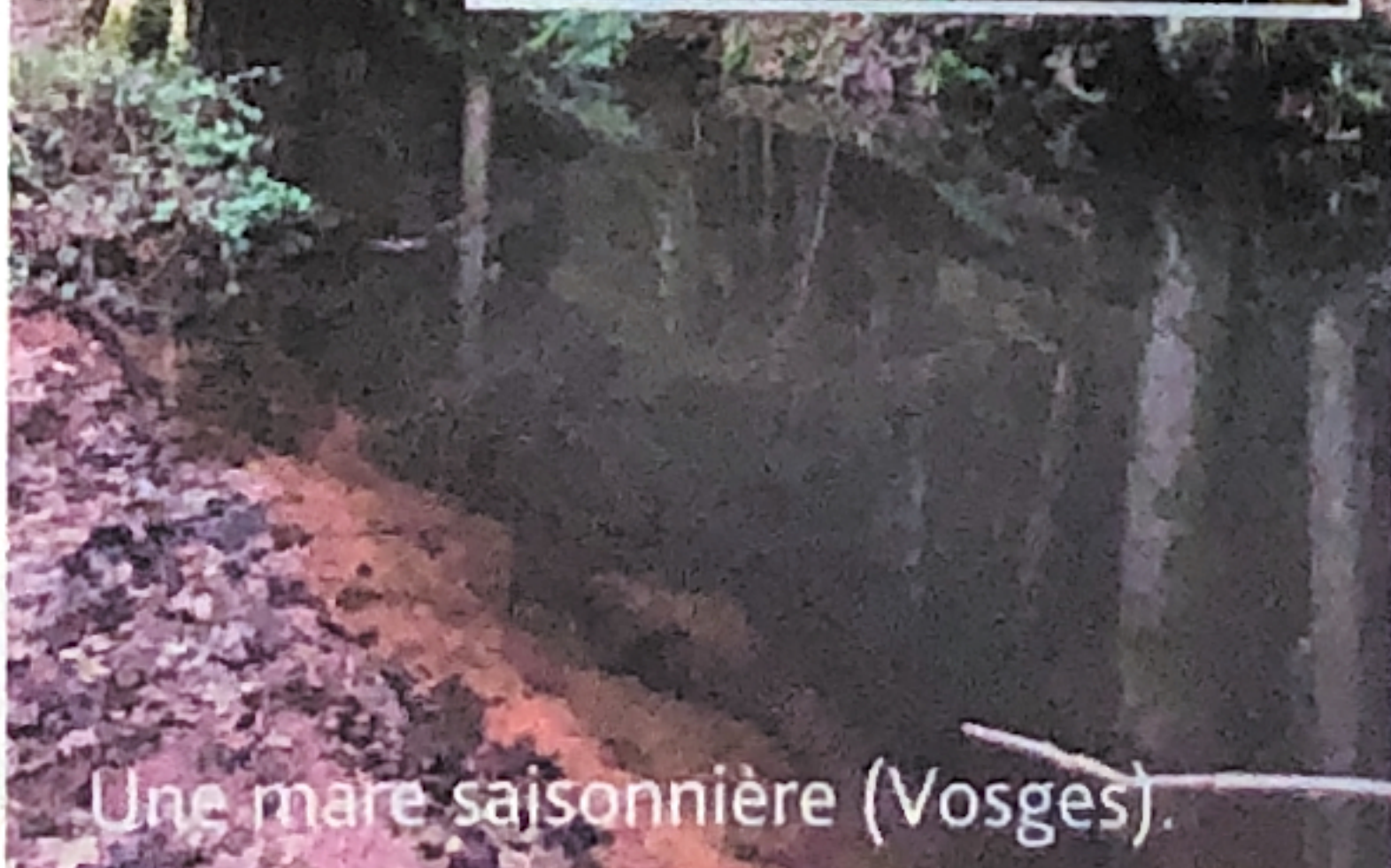
Une mare saisonnière (Vosges).